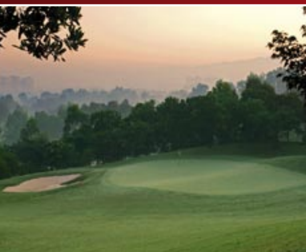
Le parcours Els, au petit matin.

Une main d'œuvre bon marché et nombreuse permet de nettoyer les abords des parcours régulièrement.